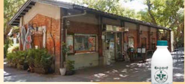
農產品展售中心外觀 11

農產品展售中心能買到臺大農場自產的農產品，包括麵包、土司、冰品及超搶手的臺大鮮奶。