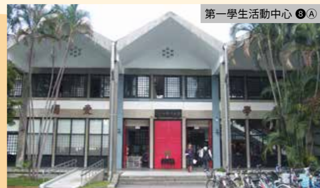
第一學生活動中心 ⑧(A)

校園內共有 2 個學生活動中心：第一學生活動中心(⑧A)鄰近總圖書館，別具中式古典特色的 2 層樓高建築物內，麻雀雖小五臟俱全，擁有學生社團辦公室、學生餐廳、大禮堂及展示空間，校內簡稱為活大。第二學生活動中心(⑧B)簡稱為二活，為高 13 層的大樓，由於臺大實際運作的社團有 400 多個，許多需要較大使用空間的社團則以此為基地，該大樓同時有餐廳及大型演講廳，許多學術研討會亦在此辦理。