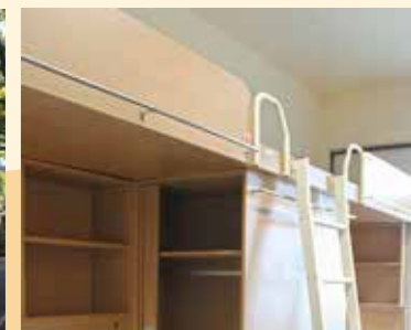
女六舍寢室 (醫學院校區)