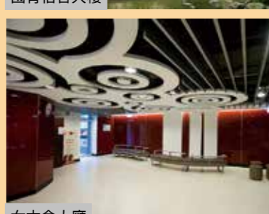
國青研三宿舍大廳