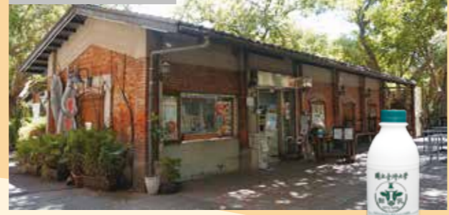
農產品展售中心外觀 11

農產品展售中心能買到臺大農場自產的農產品，包括麵包、土司、冰品及超搶手的臺大鮮奶。