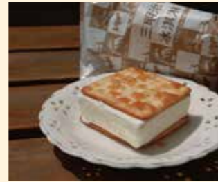
三明治冰淇淋 紅蘿蔔吐司