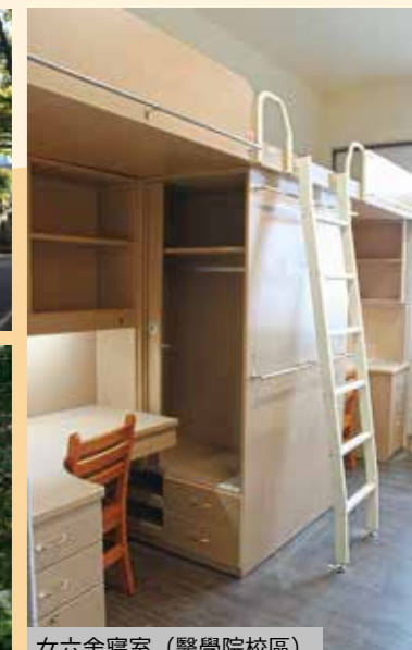
女六舍寢室 (醫學院校區)