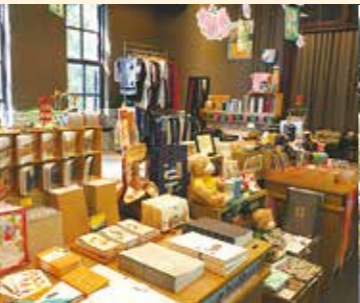
校史館 2 樓書店內部 12(A)