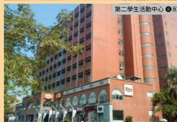
第二學生活動中心 ⑧(B)